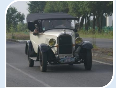
CITROEN C4 Torpédo (1930)