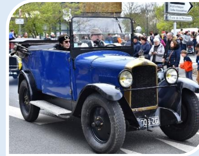
Peugeot 177 (1923)