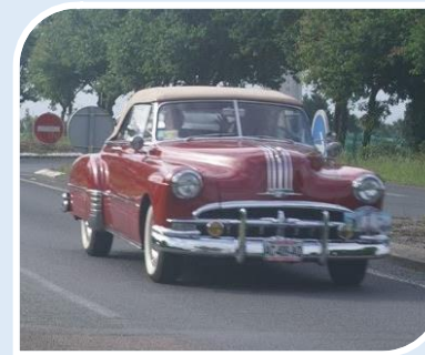
PONTIAC Cheftain (1949)