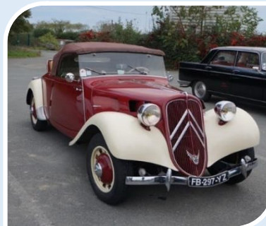
CITROEN Traction 11BL Cab (1937)