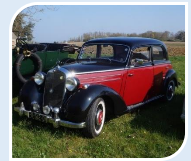
MERCEDES SD 170 (1950)