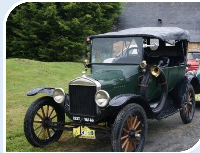
Ford T (1921)