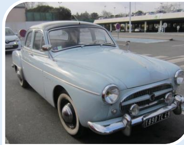
RENAULT Frégate Grand Pavois (1956)