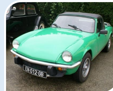
TRIUMPH 1500 (1971)