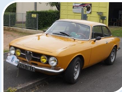
ALFA ROMEO Bertone (1969)