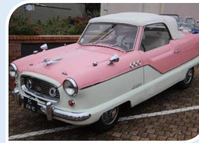
NASH Metropolitan (1957)