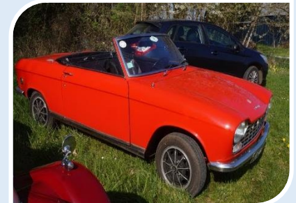
PEUGEOT 204 Cab (1967)