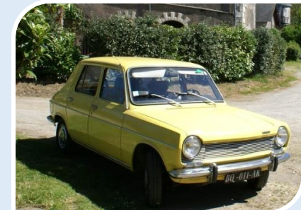
SIMCA 1100 (1975)